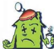
dégradation du logement (humidité, moisissures)

A fin de vous prémunir contre tous ces désagréments et d'éviter les pathologies consécutives à une ventilation insuffisante (odeurs, moisissures, décollement des papiers peints, apparitions d'auréoles humides, condensation sur les murs...), pensez, dès à présent, à prévoir des entrées d'air (dimensionnées et positionnées selon le cahier du CSTB et la fiche technique de l'UF PVC, et, conformes à la réglementation en vigueur) sur vos nouvelles fenêtres dans les pièces principales qui doivent être en adéquation avec les caractéristiques d'isolation acoustique de vos fenêtres.